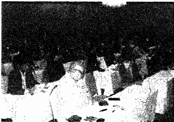
集会には約170人が参加した

今年の「歴史・人権週間」は、1905年条約(乙巳五条約)と強制連行犠牲者の遺骨問題、日本も批准している人種差別撤廃条約から見た在日朝鮮人に対する日本政府の抑圧政策の問題点の3つをテーマとしている。